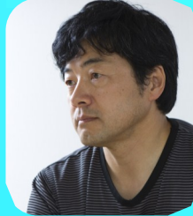
瀬木直貴 映画監督 四日市市観光大使