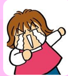
現代洋子 漫画家 四日市市出身